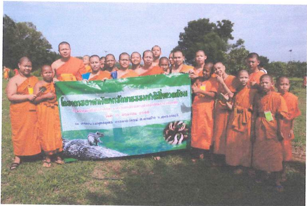
ก่อนวันปิดโครงการปฏิบัติธรรมทางพระพุทธศาสนา ปีการศึกษา ๒๕๖๐