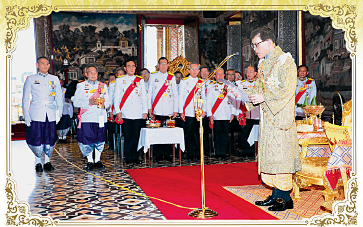
พระบาทสมเด็จพระปรเมนทรรามาธิบดีศรีสินทรมหาวชิราลงกรณ พระวชิรเกล้าเจ้าอยู่หัว